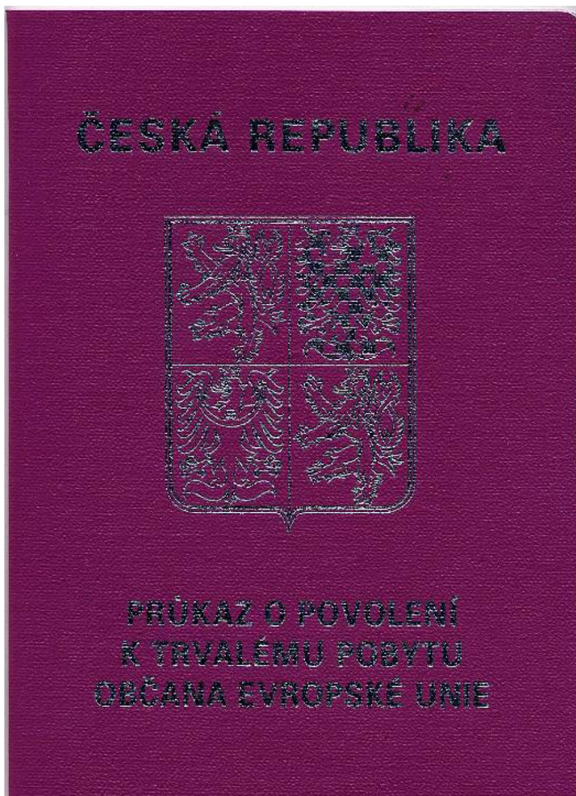
Přední strana dokladu (fialový doklad ve formě knížky, stříbrný tisk na přední straně)