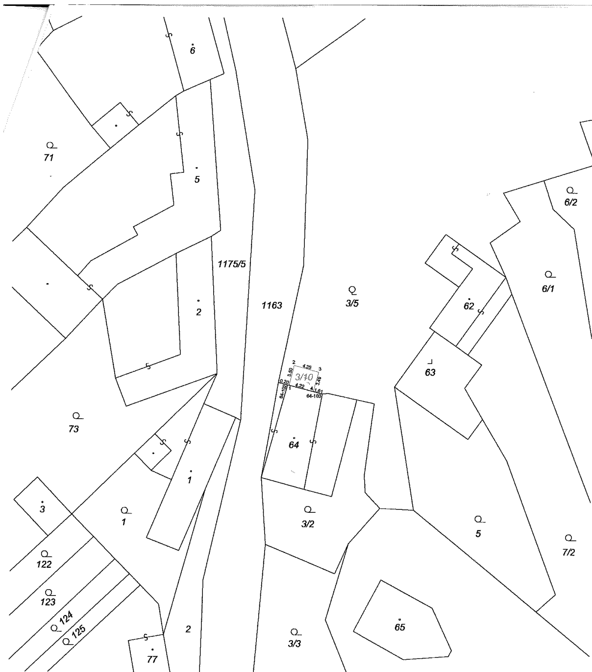
Seznam souřadnic (S-JTSK):